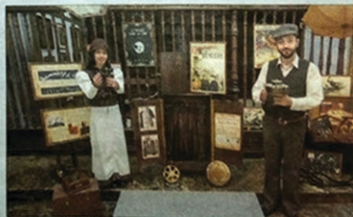
Los hermanos Reynaud son los guías de este particular carrusel.

un segundo plano por ser mujer, o el español Segundo de Chomón. Aquí tienen su hueco.