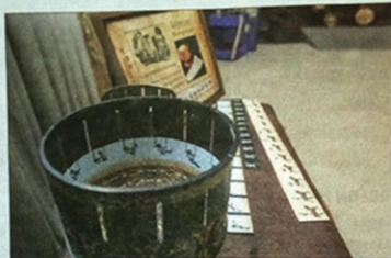
El zoótropo es uno de los artilugios precursores del cinematógrafo.

Este peculiar carromato también se quita el sombrero ante los pioneros del séptimo arte. Los hermanos Lumière, su contemporánea Alice Guy Blaché, productora y directora de cine a la que la historia ha relegado a